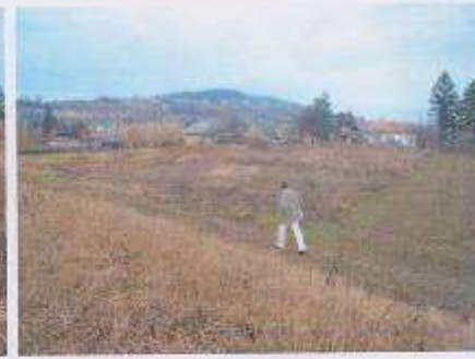
A szekszárdi 5794/15 és 5794/14 hrsz. ingatlan jellemző fotói 2009.01.20. 1