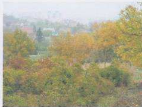
Látkép a telekről