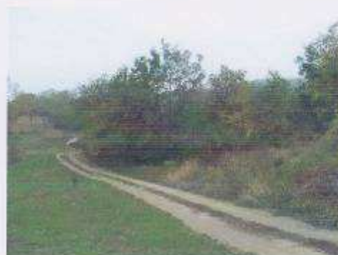
Telekre vezető út