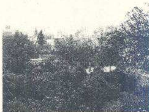
Látkép a telekről