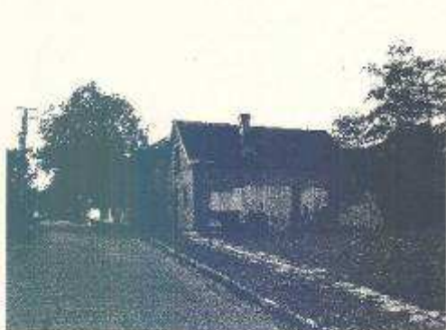
Szekszárd, Bocskai u. 15.